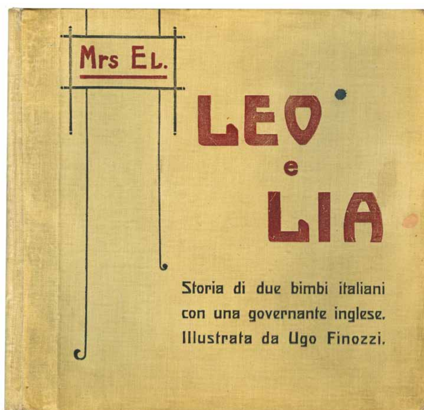
Leo e Lia, Storia di due bimbi italiani e di una governante inglese , Firenze Bemporad, 1909. Illustrazioni di Ugo Finozzi.

In Laura restava viva più che mai la passione di raccontare storie ai bambini: "Ecco, ho sempre, da quando mi posso ricordare, raccontato storie ai bambini; chiedevo a tutti di raccontarne a me, e quando non potevo trovar nessuno, ne raccontavo io ai più piccoli", scriverà di sé negli anni '30.