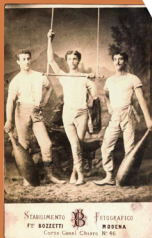
Atleti ebrei della Società del Panaro, a Modena. L'emancipazione portò a una serie di trasformazioni nell'identità tradizionale ebraica collettiva, gettando le fondamenta di una società ebraica moderna e fortemente secolarizzata

La mostra che qui viene presentata vuole essere un omaggio a tutte quelle persone che con il loro supporto morale e materiale aiutarono gli ebrei in quei tempi così bui e disperati.