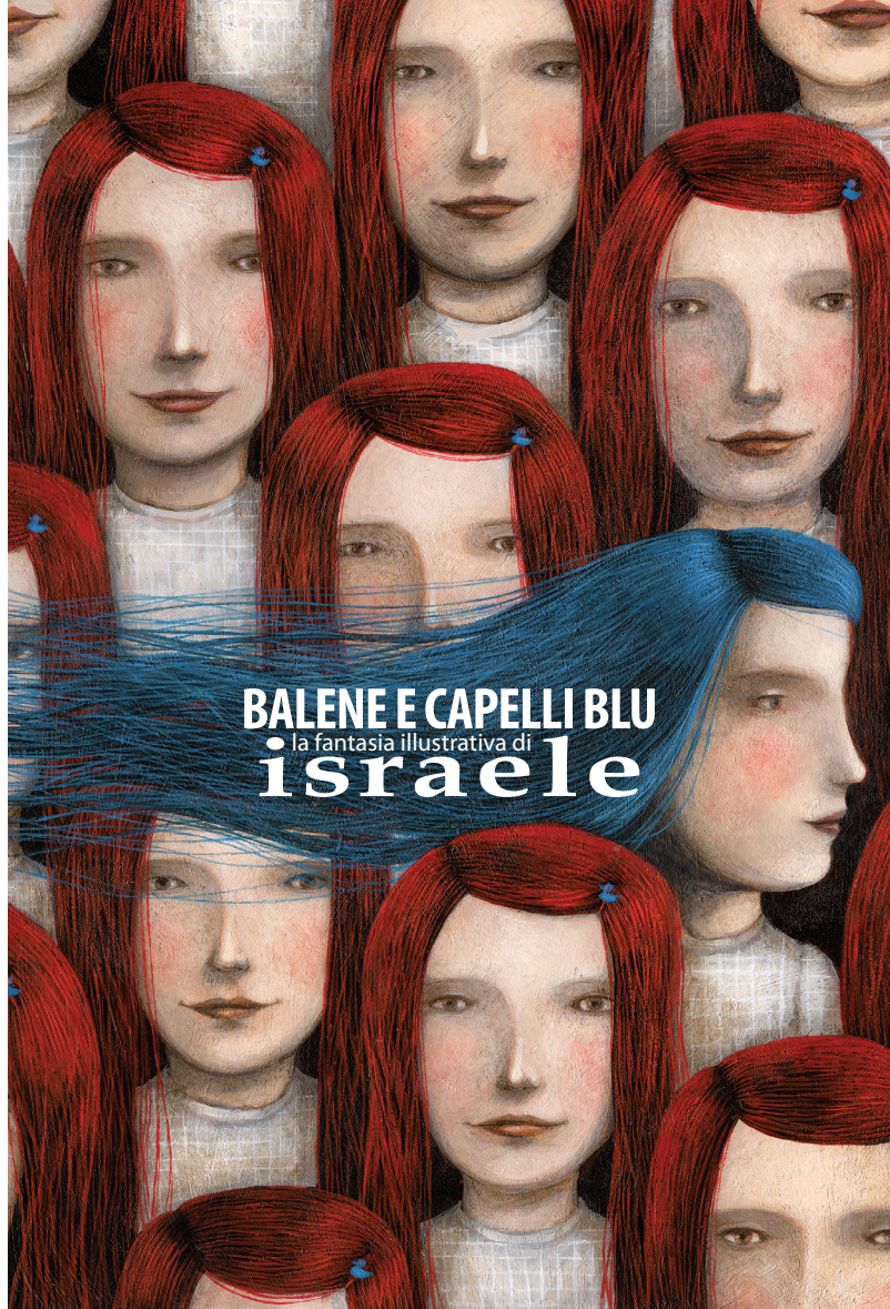
illustrazione frontespizio: Ofra Amit | Sea # 4, 2010 illustrazione interna: Orit Bergman | Diary of a Shark Catcher

Museo Ebraico di Bologna 24 marzo > 4 maggio 2014